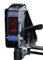
Niveau automatique (lors de la commande, bien préciser la plage de réglage souhaitée)