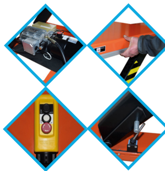
Cadre de sécurité anti-écrasement