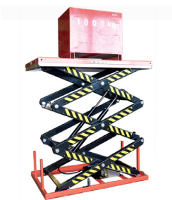
Groupe électro hydraulique bucher