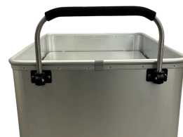
Poignée réglable sur 100 mm