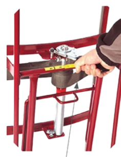
Sangle de maintien avec tendeur