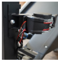
Sangle de sécurité