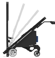
Système de basculement