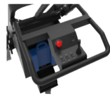
Console de commande