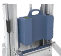
Batterie Lithium amovible