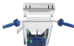
Déplacement et élévation contrôlées au niveau des poignées