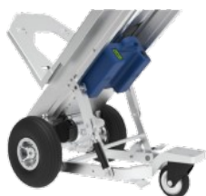
Roue auxiliaire rabattable