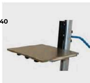
Plateau à rouleaux aux extrémités