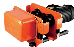
OPTION Chariot porte-palan pour les modèles FT PECM502 et FT PECM1001