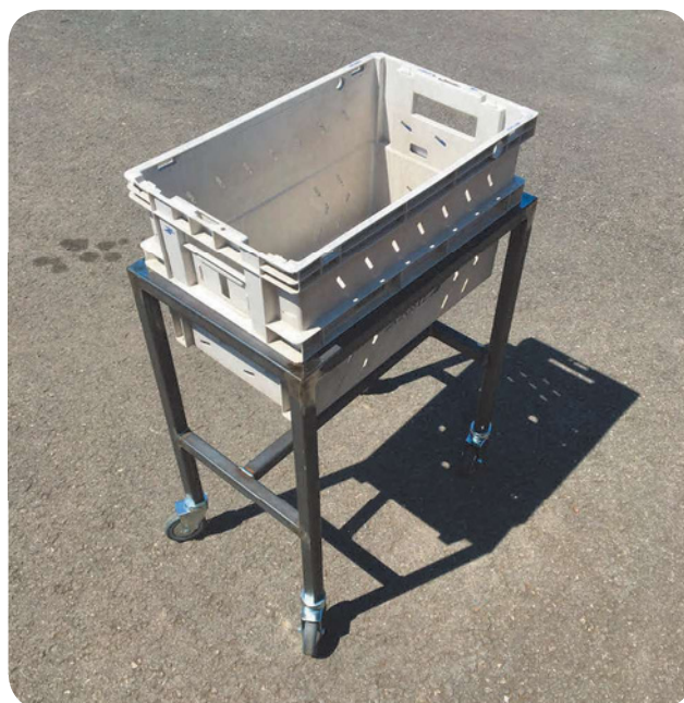
Rehausse porte bac postal