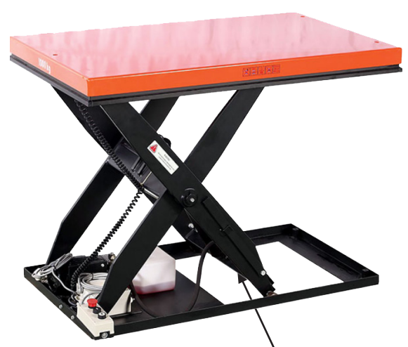
Câble de 3 m