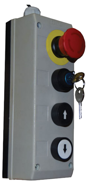
Télécommande avec câble de 3 m de série