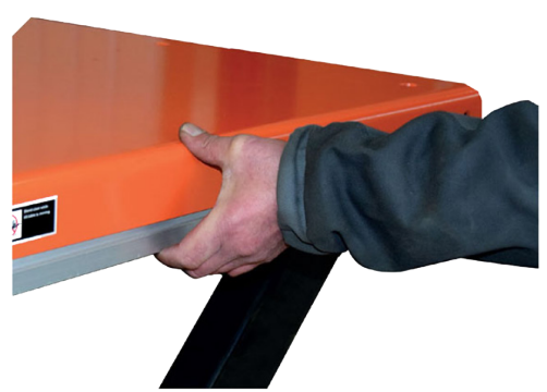
Cadre de sécurité anti-écrasement