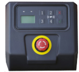
Ecran LCD avec démarrage par code PIN et carte RFID