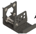
Crochet livré de série