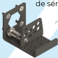
Crochet livré de série