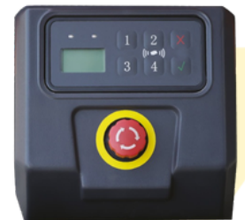
Ecran LCD avec démarrage par code PIN et carte RFID