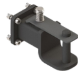
• Crochet à broche