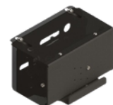
• Crochet électrique